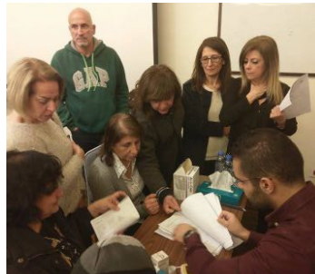
حملة عن أمراض القلب في الأشرفية