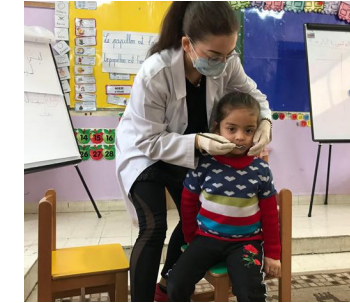
حملة الأسنان في المدارس الريفية