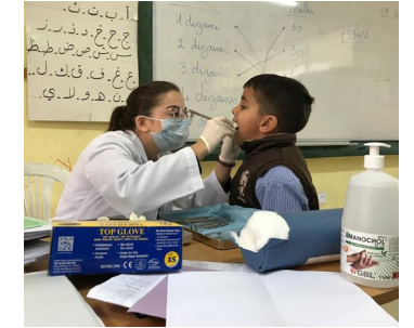
حملة الأسنان في المدارس الرسمية