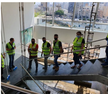
رفع أنقاض ورمم بعد كارثة بيروت