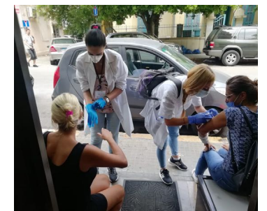
اسعافات ميدانية بعد انفجار بيروت