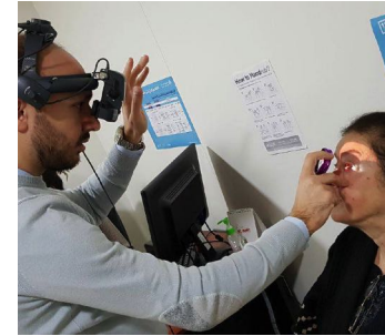
حملة العيون في كسروان