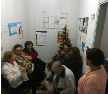
حملة الكشف عن السرطان في الأشرفية