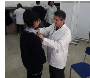
حملة الطب العام في مدارس اعالي كسروان