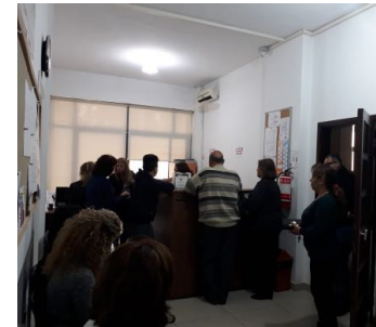
حملة توزيع أدوية مجانية في زوق مصبح