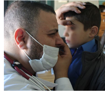
حملة الطب العام في مدارس البترون