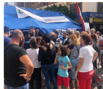
توزيع أدوية بعد انفجار بيروت