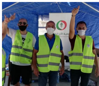
متطوعون لتقديم الدعم الميداني