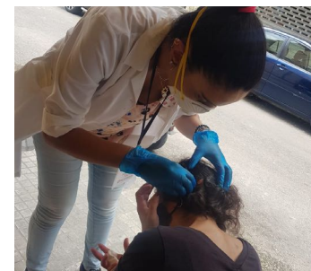
اسعافات أولية بعد تفجير المرفأ