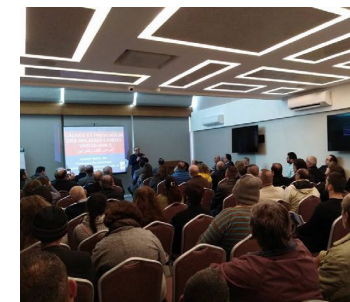
حملة توعية عن أمراض القلب والسكري