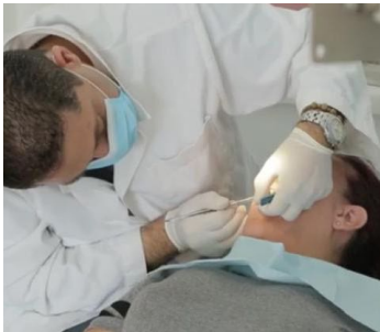
حملة الأسنان في قنات قضاء بشري